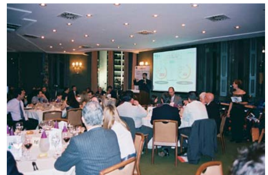
Cena de Gala 2003. Círculo Ecuestre de Barcelona.