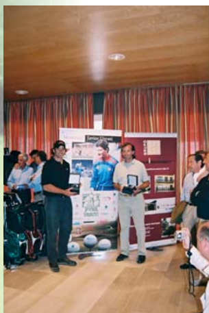
Torneo benéfico Memorial Urruti. Club de Golf Masía Bach.