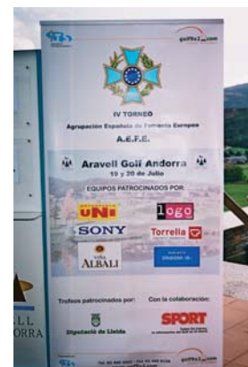
Torneo AEFE (Asociación de Fomento Europeo Español). Aravell Golf Andorra.